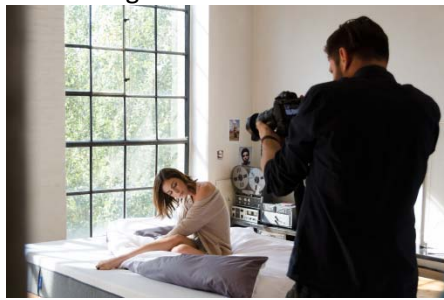
Making of zum Shooting mit Lena Meyer-Landrut und Emma Matratzen