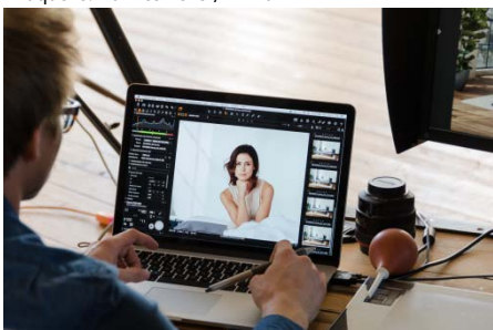
Making of zum Shooting mit Lena Meyer-Landrut und Emma Matratzen