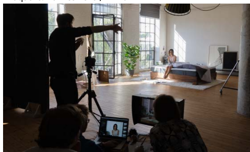
Making of zum Shooting mit Lena Meyer-Landrut und Emma Matratzen